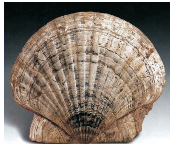
Pecten ligerianus Mioceno