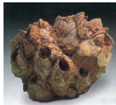
Balanus concavus Mioceno

Aunque el género es más antiguo, las especies que conocemos aparecieron hace unos 60 millones de años y actualmente viven en fondos rocosos y arenosos, protegiéndose en las rocas o cuevas que excavan. Algunas especies lo hacen dentro de conchas vacías de caracoles (el Ermitaño).