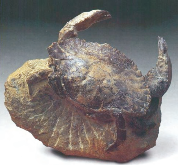
Cancer sismondai Mioceno

Los Crustáceos constituyen un numeroso grupo de especies marinas, pero en este caso nos ocuparemos de los Balanus y los Cangrejos ya que son los géneros que relativamente podemos encontrar fósiles.