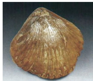
Rhynchonella sp. Cretácico

La línea de contacto de ambas valvas se llama "comisura".