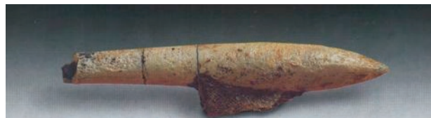
Belemnites Hibolites hastatus Jurásico

La mayoría de estas especies desaparecieron de nuestros mares hace 65 millones de años (al mismo tiempo que los Dinosaurios). Hoy los encontramos mineralizados como fósiles en nuestros montes.