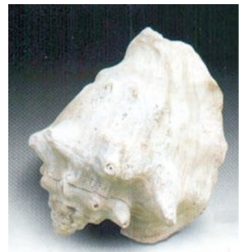
Strombus bubonius Cuaternario

En la mayoría de los Gasterópodos que aparecen fósiles se encuentran sólo los moldes internos, ya que su concha formada por Aragonito se ha disuelto durante el proceso de fosilización. Sólo en algunos casos, aparecen con su concha transformada en Calcita.