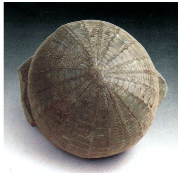
Echinocorys ovatus Cretácico

Estos cambios o adaptaciones señaladas ocurrieron durante la Era Secundaria (hace unos 200 mill. de años.) Posiblemente lo hicieron para defenderse de los grandes depredadores de la época.