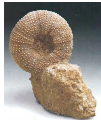
Psammechinus caillaudi Plioceno

Sobre su dieta, la mayoría son fitófagos (comen algas) u omnívoros (comen de todo) gracias a su aparato mandibular denominado "Linterna de Aristóteles".