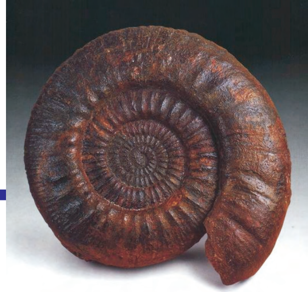
Ammonites Indosphinctes choffati Jurásico

Los Cefalópodos son los animales invertebrados más grandes que han existido y existen en la actualidad (calamares de unos 15 m. de largo, pulpos de considerable tamaño etc...)