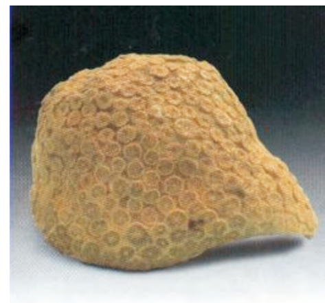
Phyllocaeniopsis sp. Cretácico

Algunos de los corales tienen forma ramosa o arbustivo, por lo que antiguamente se les confundieron con plantas marinas.