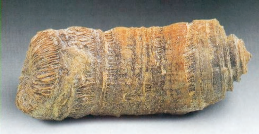
Montlivaltia obconica Cretácico