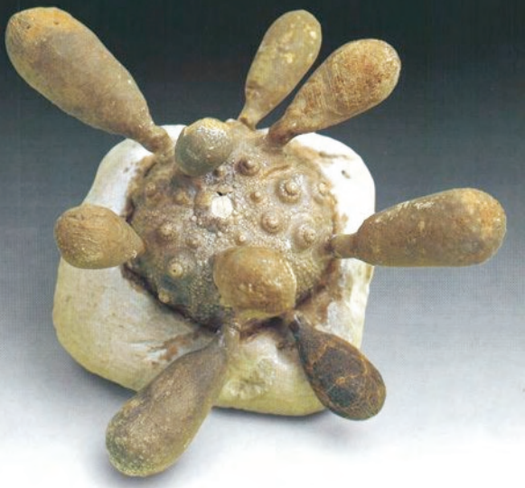
Hemicidarid con radiolas Cretácico