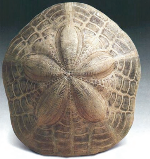
Clypeaster partschi Mioceno