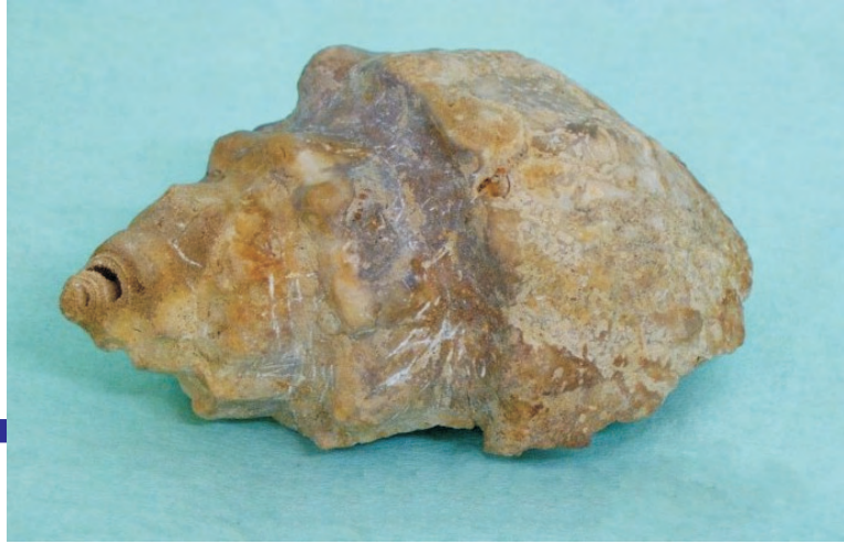
Colombellina sp. Cretácico

Estos moluscos son los que mejor se han adaptado a través de su historia a cualquier ambiente: Primero marino y después aguas dulces y terrestres.