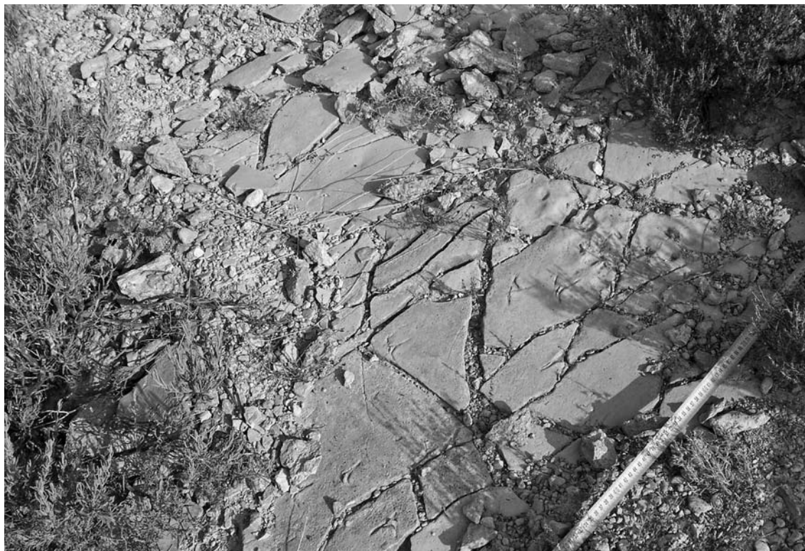
Lámina 1. Disposición de las impresiones de huellas en el sustrato rocoso.

Se ha abordado en todo momento una excavación de tipo manual, de acuerdo con las características del terreno y del yacimiento en sí mismo, para posteriormente proceder a la documentación y extracción del mismo.