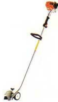
Desbrozadora con un accesorio recortabordes

Sirven para recortar los bordes del césped que dan a macizos y borduras y dejarlo perfectamente perfilado. Este trabajo también se puede hacer con la desbrozadora de de hilos de nylon protegiéndose los ojos e inclinando la máquina. O con un palín , también llamado pala de jardinero. Pero estas máquinas están diseñadas exclusivamente para esto. Si dispones de tiempo y ganas o tampoco tienes tanto que perfilar, con la pala de jardinero se hacen los macizos y alcorques incluidos en el Césped perfectamente bien.