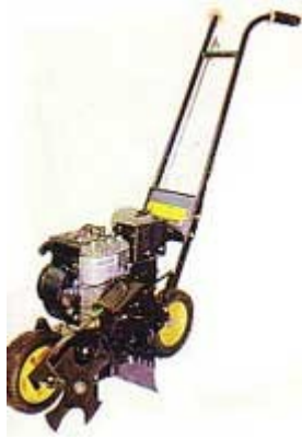
Máquina profesional. Para un jardín familiar no merece la pena comprar