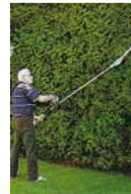
Desbrozadora con accesorio cortasetos