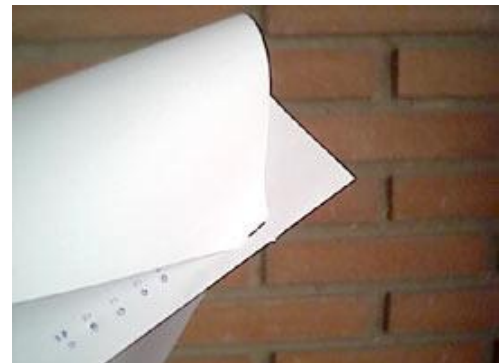
detalle de la parte de la nariz. Este modelo tiene varios agujeros para hacer pruebas