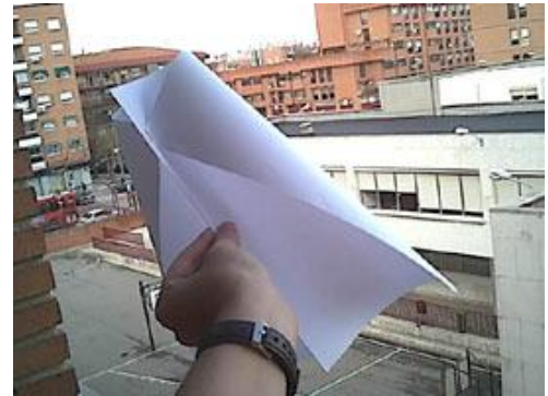
vista inferior del abejorro, una de las mejores cometas para talleres