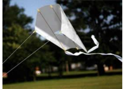
El sled, un buen diseño para iniciarse en la construcción de cometas.