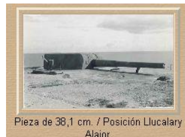
Pieza de 38,1 cm. / Posición Llucalary Alaior.

El 11 de mayo de 1944 se puso a flote, tras diez años en grada, él "D-1" (siendo el primer submarino botado en España después de la guerra civil) pero su entrega a la Marina no tuvo lugar hasta tres años más tarde, en marzo de 1947, siendo entonces cuando aparecieron todos sus múltiples problemas.