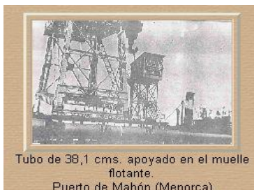
Tubo de 38,1 cms. apoyado en el muelle flotante. Puerto de Mahón (Menorca)