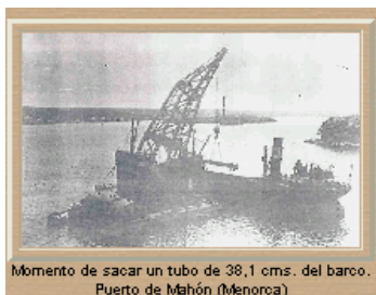
Momento de sacar un tubo de 38,1 cms. del barco. Puerto de Mahón (Menorca)

En mayo de 1931 se transportó desde Barrow (Inglaterra) en un barco correo hasta el puerto de Mahón (Menorca) todo el material de los dos cañones de 38,1 cm. para la POSICIÓN LLUCALARY, por lo que para su desembarco tuvo que desplazarse la grúa Sansón desde Cartagena.